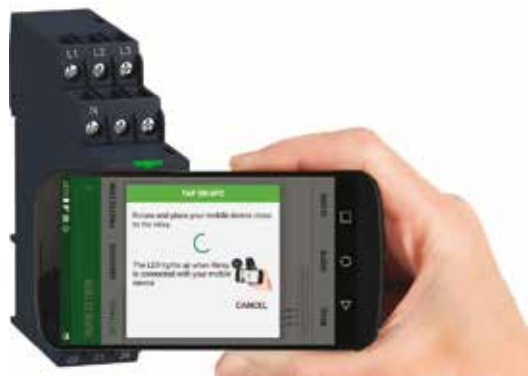
Rychlá automatická konfigurace: párování kontrolního relé Zelio Control NFC a chytrého telefonu s aplikací Zelio NFC