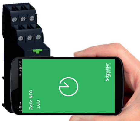
Párování časového relé Zelio Time NFC (připravenost signalizuje zelená LED) a chytrého telefonu s aplikací Zelio NFC